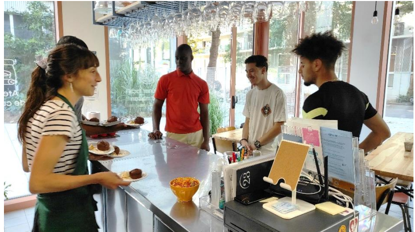
(À droite) Atelier « Gestion du budget » avec l'association CRESUS / (À gauche) Atelier « Cuisine et Diététique » avec les équipes du restaurant Fair.e

« Du sport à l'emploi » : Témoignages et programme détaillé de la 1 ère session ici https://gamma.app/docs/Du-sport-vers-lemploi-pbn9qzov8zv314t?mode=doc