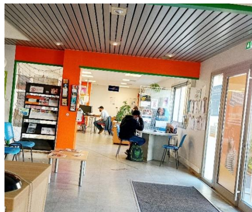
Atdec Nantes Métropole - Site Est, l'un des 8 sites d'accueil Atdec ouvert du lundi au vendredi

L'Atdec Nantes Métropole va relayer sa campagne 2024 sur les réseaux sociaux mais également dans l'espace public grâce au soutien de Nantes Métropole à partir de novembre ! En plus de cela, des relais précieux sont à citer, comme l'Accord Nantes ou encore Nantes Métropole Habitat . En effet, le bailleur social affiche actuellement cette campagne dans les halls d'immeubles dont il a la gestion, alors que l'Accord le fait dans tous ses espaces d'accueil. Cela offre à l'Atdec Nantes Métropole un écho fort pour cette campagne, au plus près des publics ciblés, notamment en QPV.